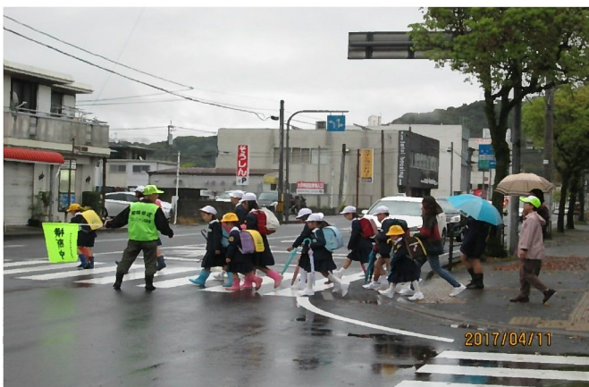
国道10号線鹿相信前交差点