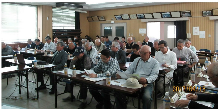
「総会風景」柁城校区内43自治会長集結