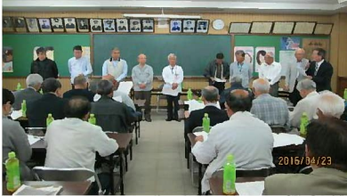
徳重会長による新役員紹介