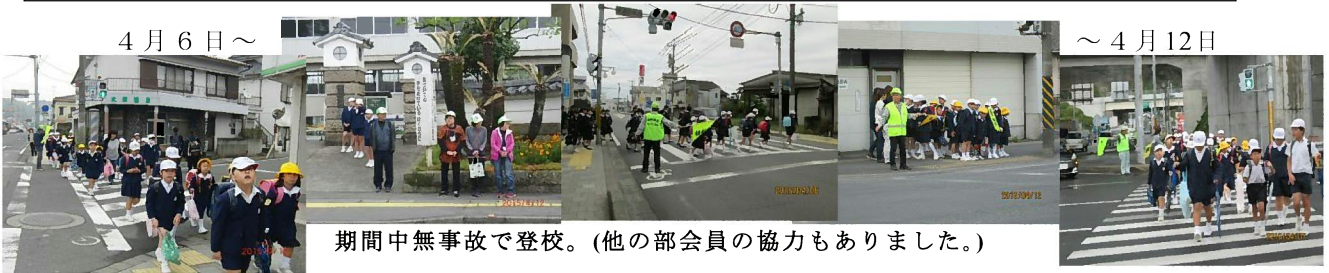
期間中無事故で登校。(他の部会員の協力もありました。)