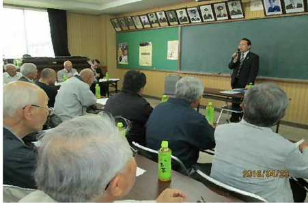
来賓（笹山市長）の挨拶