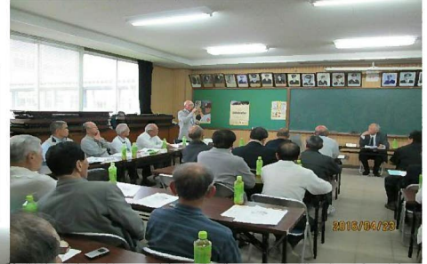
櫛山副会長の説明・提案