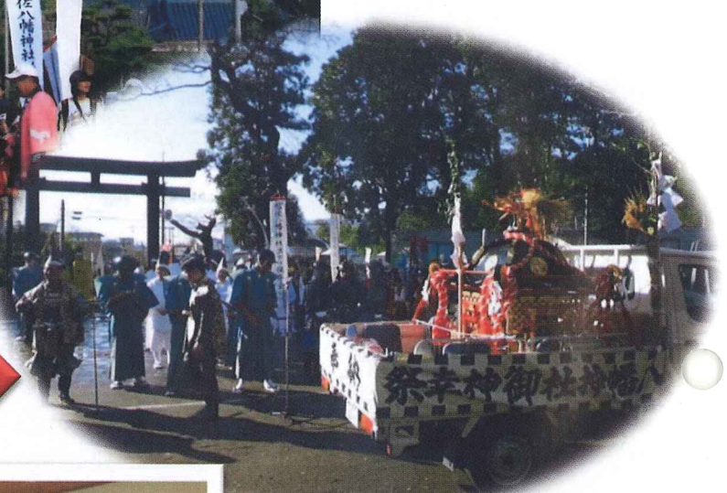
↑ 帖佐八幡神社 浜下り →