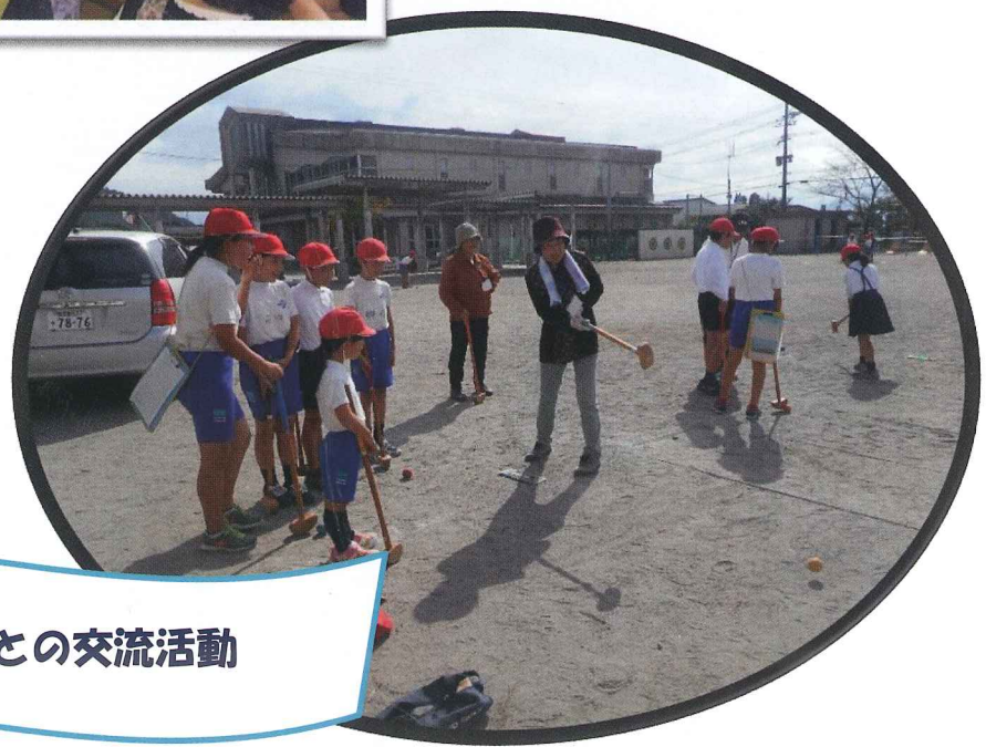
高齢者と子どもたちとの交流活動