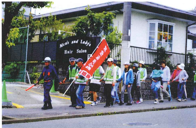
みんなそろって避難場所の小学校へ急ぐ

約百五十名の参加者は体育館に移動し、始良市の危機管理課及び消防本部・重富消防分団から、災害時の心得、AEDの使用方、簡易担架の作り方、消火訓練等を学習・体験し、非常時に活かせる有意義な時間を過ごすことができました。