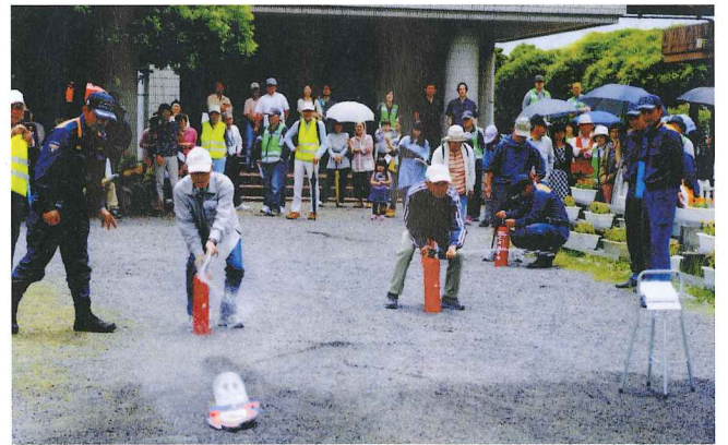
消火訓練にも熱が入ります