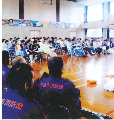
大勢で説明を聞く