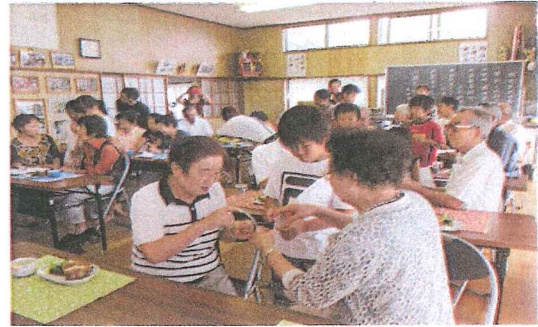
顔を見るだけでもうれしい。(北)