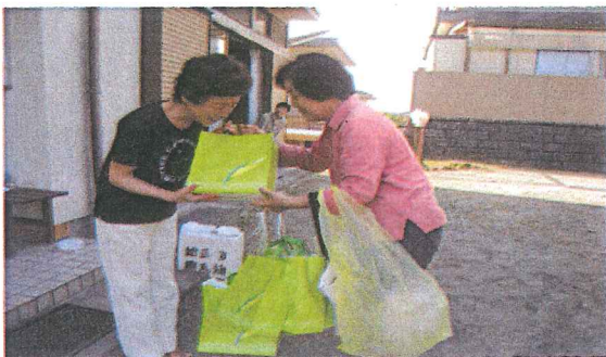
幸せは、みなさんに(東)