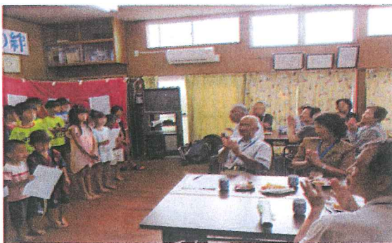
いつまでも お元気で(西)