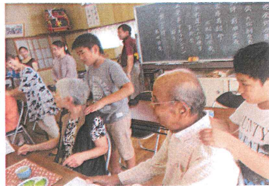
おばあちゃん、来年も来るね。(北)