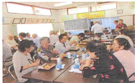
仲間づくりができます。(南)