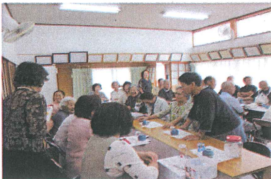
今日も楽しんでください。(南)