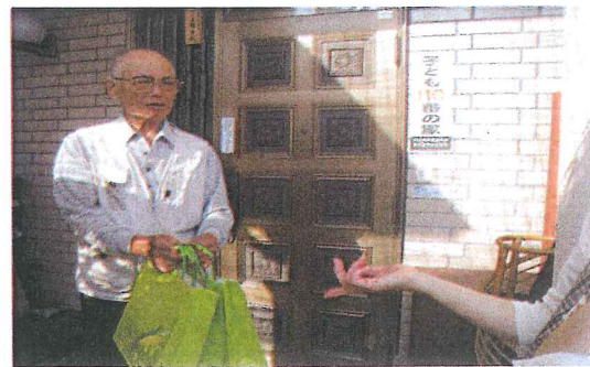
ありがとう 元気が出ます。(東)