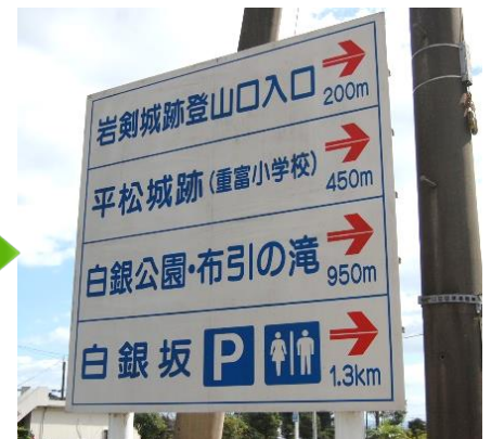
作業後、こんなに綺麗になりました。