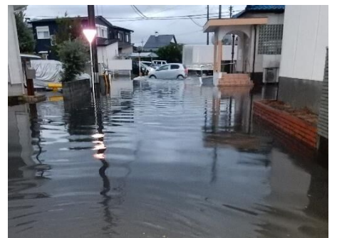
西宮島町 道路冠水 (事務局長 立山 洸)