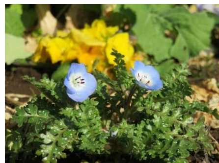
(事務局 柴 智恵)