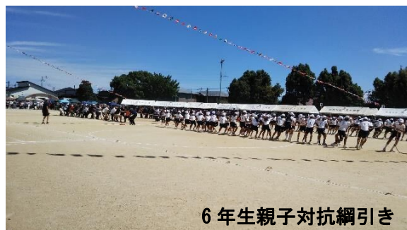
6年生親子対抗綱引き