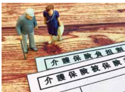
介護支援の充実を

支援としては、介護保険事業の推進、総合相談支援事業、権利擁護事業、その他様々な支援を実施している。