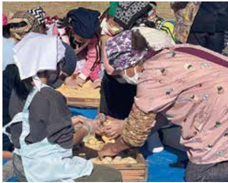
みんなで団子をこねこね