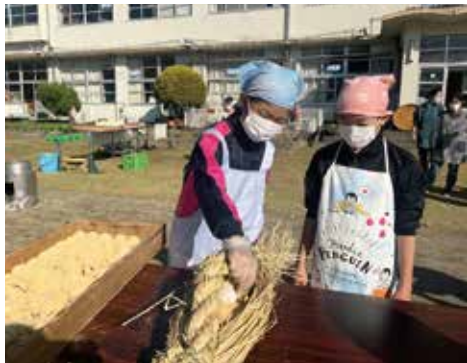
薬苞 からづと に団子を入れる様子