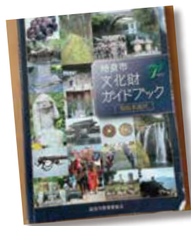
文化財ガイドブック

答 「生涯現役社会の実現と自立支援・健康づくりの推進」、「認知症の発症を遅らせ、認知症になっても希望を持って暮らせる体制の整備」、「在宅でも安心して暮らせるための医療と介護の連携の充実」などの目標を設定し、高齢者が安心して暮らし続けることができるようにするための取組を推進している。