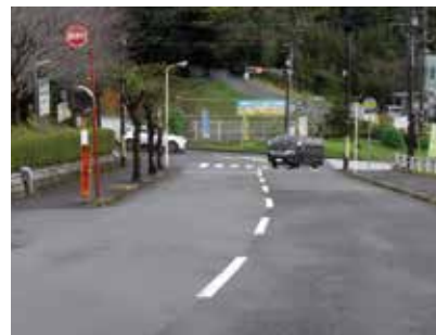
舗装工事が始まる始良ニュータウン入口交差点

答 年度内の完了予定としており、県道との交差点を含んだ工事となるため県道路管理者との協議が整い次第着工となる。