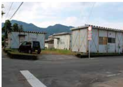
被災者一次避難住宅

※ファシリティマネジメントとは 企業・団体等が組織活動のため、施設とその環境を総合的に企画、管理、活用する経営活動。