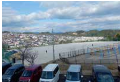
ブルーラインスポーツパーク始良多目的広場

市としては、多目的広場への付属施設を充実させ、利用者のニーズに沿った整備を行うこととした。詳細な内容は、今後、庁内で協議していく。