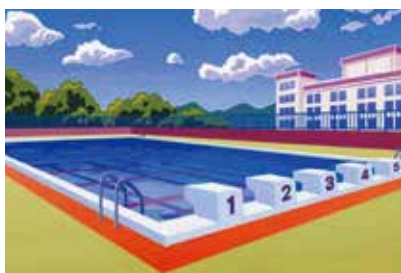
今後の学校プール

答 長寿命化と併せて検討することになるが、水泳授業が効果的かつ計画的に実施できるよう民間の活用も含めて調査・研究をしている。