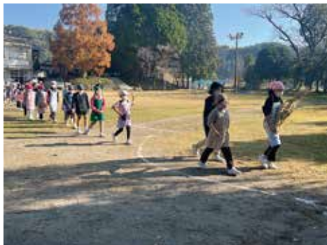
お供えに向かう子どもたち