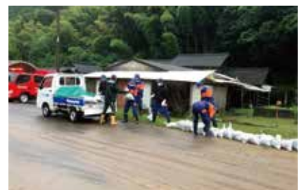
安全安心を守る'あなたのまちの消防団'

報酬の見直しや機能別団員制度・休団制度の導入を本年度から実施し、ポスター掲示やホームページへの掲載も行っている。今後、未来の団員育成・自治会やコミュニティ協議会等と協力するなど、団員増に向けた様々な取組を行っていく。