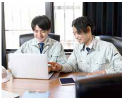
研修風景(イメージ)

品質確保の取り組みとして、入札契約方式の選択肢を広げるために、最低入札価格調査制度の導入について、調査・研究を進めたいと考えている。