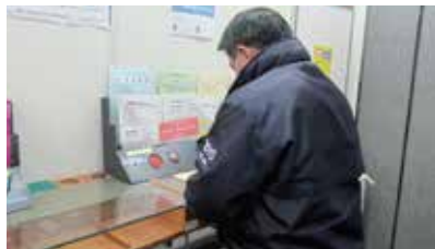
「書かない窓口」を望む