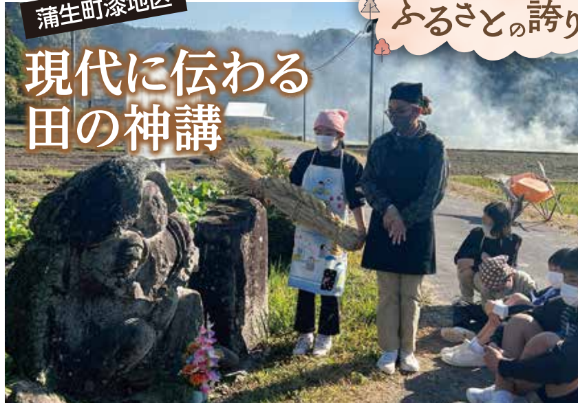
団子をお供えする子どもたち