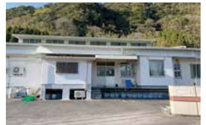
統合される加治木給食センター

施設整備計画の検討では、栄養教諭に対してヒアリングシートを配布し、それを基に意見交換会を行った。