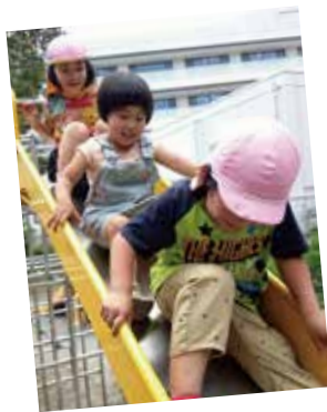
子ども医療費高校生まで無料化を

答 持続可能な制度運用を行うため、本年9月に庁内検討委員会を立ち上げた。委員会では、本市の子ども医療費助成制度の現状、今後の医療費推計等について協議を行った。今後も子ども医療費助成制度の拡充は、継続した事業の実施や財源等も含め、引き続き検討していく。