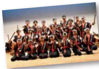
表紙の写真は、「蒲生郷大楠少年太鼓」 現在メンバーは小学1年生から中学3年生までの24名。蒲生地区以外にも参加しています。