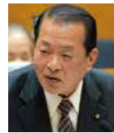
国生 卓 志成会