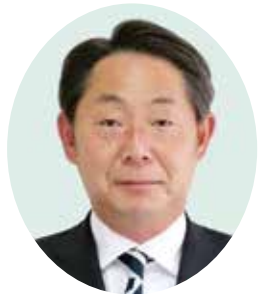
副議長 犬伏 浩幸