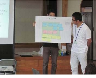
○ 住民と協働のまちづくり