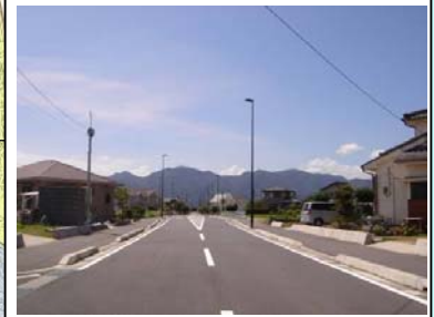
■ 基幹事業: 都市計画道路菅原線整備