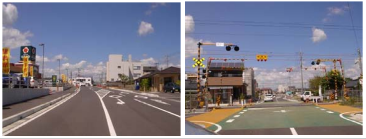
■ 基幹事業: 都市計画道路宮島線整備