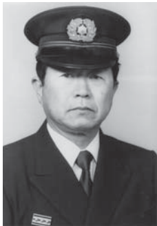
5代 村岡 創造 自 昭和58年8月1日 至 昭和61年12月31日