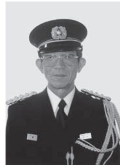
8代 雨 乞 信 自 平成2年4月1日 至 平成9年3月31日