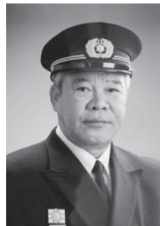
2代 黒木 俊己 自 平成23年4月1日 至 平成26年3月31日