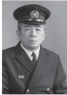
2代 下猶 篤男 自 昭和47年4月1日 至 昭和49年12月31日