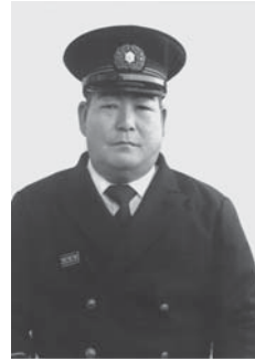
3代 坂元 満男 自 昭和50年1月1日 至 昭和53年3月31日