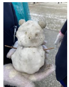
出来たよと見せてくれました。動物とハート形の作品